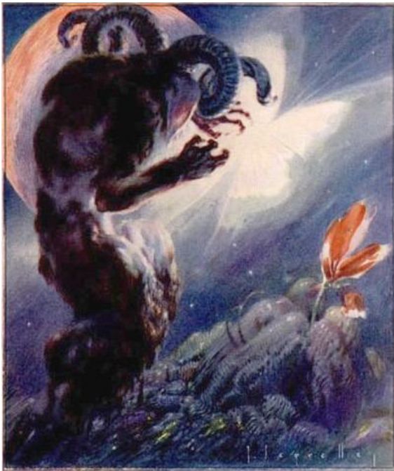
Il·lustració de la sonata "Clar de Lluna" de Beethoven. London News . 1927.