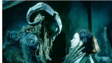
Fotograma de la pel·lícula "El laberinto del fauno"